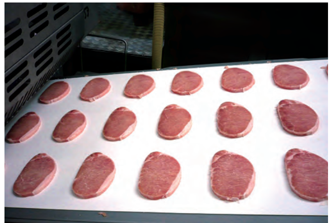
cutting 210 slices/min