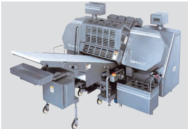
TS-490 capable of swing feed at an inclined angle of 45°