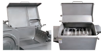
顶盖（左图）和前盖（右图）各装有安全感应器