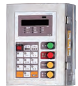
久田的重量指示计 (FC-W)