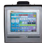
大型タッチパネル