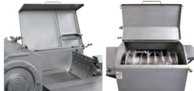
トップカバー・フロントカバーに安全装置付