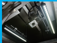
上部LED照明付カメラ