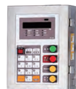
クボタの重量指示計(FC-W)