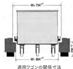
適用ワゴンの関係寸法