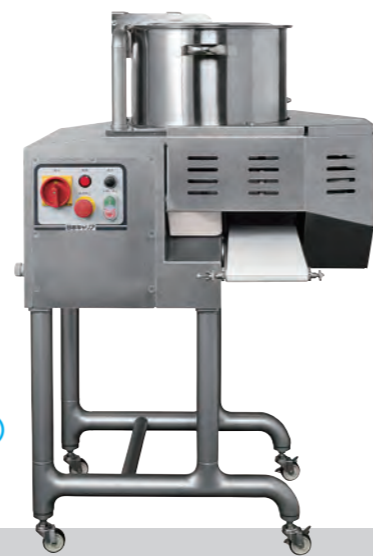
Model S-201H (スタンド型) Model S-201H (Standing Type)