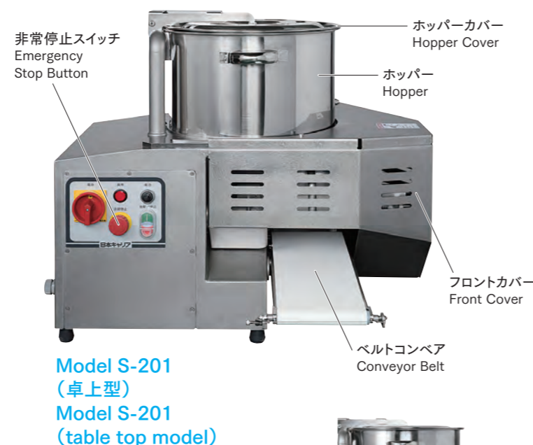
Model S-201 (卓上型) Model S-201 (table top model)

Can also be used to fill with pre-determined amounts